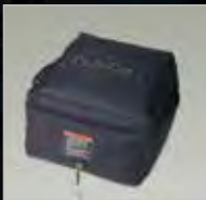
RÉCHAUFFEUR DE PLATS