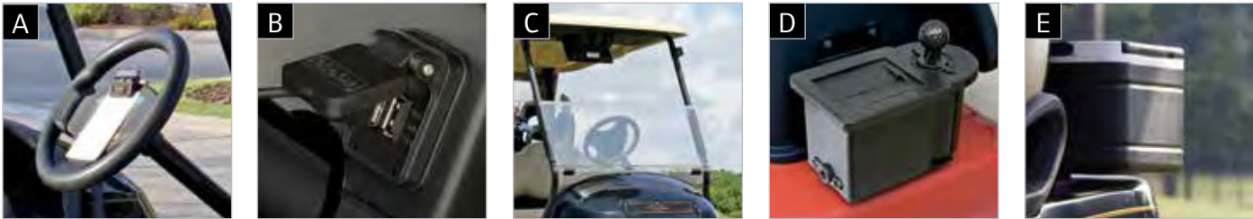
A VOLANT CONFORTABLE B DOUBLE PORT USB C PARE-BRISE À CHARNIÈRE D NETTOYEUR DE BALLE ET DE CLUB E GLACIÈRE CADDIE

Disponible sur les véhicules Precedent 2 passagers, et comprend des fonctionnalités spéciales golfeur. Inclut les accessoires A - C et deux accessoires de votre choix (D - H).