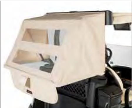
HOUSSE DE SAC