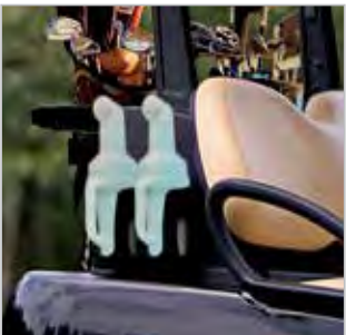
DEUX BOUTEILLES DE SABLE