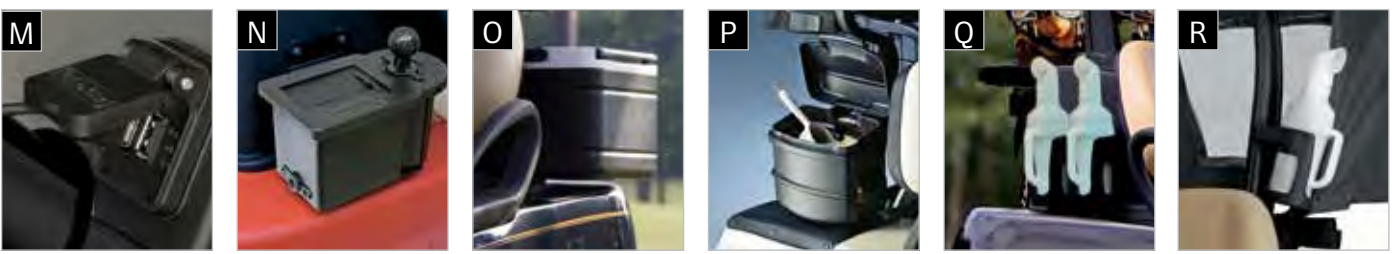
M DOUBLE PORT USB N NETTOYEUR DE BALLE ET DE CLUB O GLACIÈRE CADDIE P SEAU À SABLE Q DEUX BOUTEILLES DE SABLE R BOUTEILLE DE SABLE