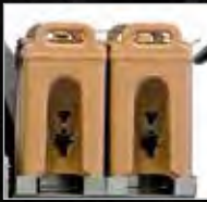
DISTRIBUTEURS DE BOISSON