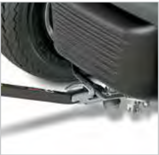
DISPOSITIF DE REMORQUAGE DE LUXE