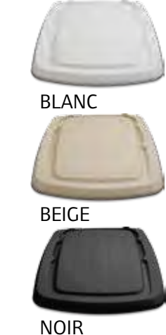
BLANC BEIGE NOIR