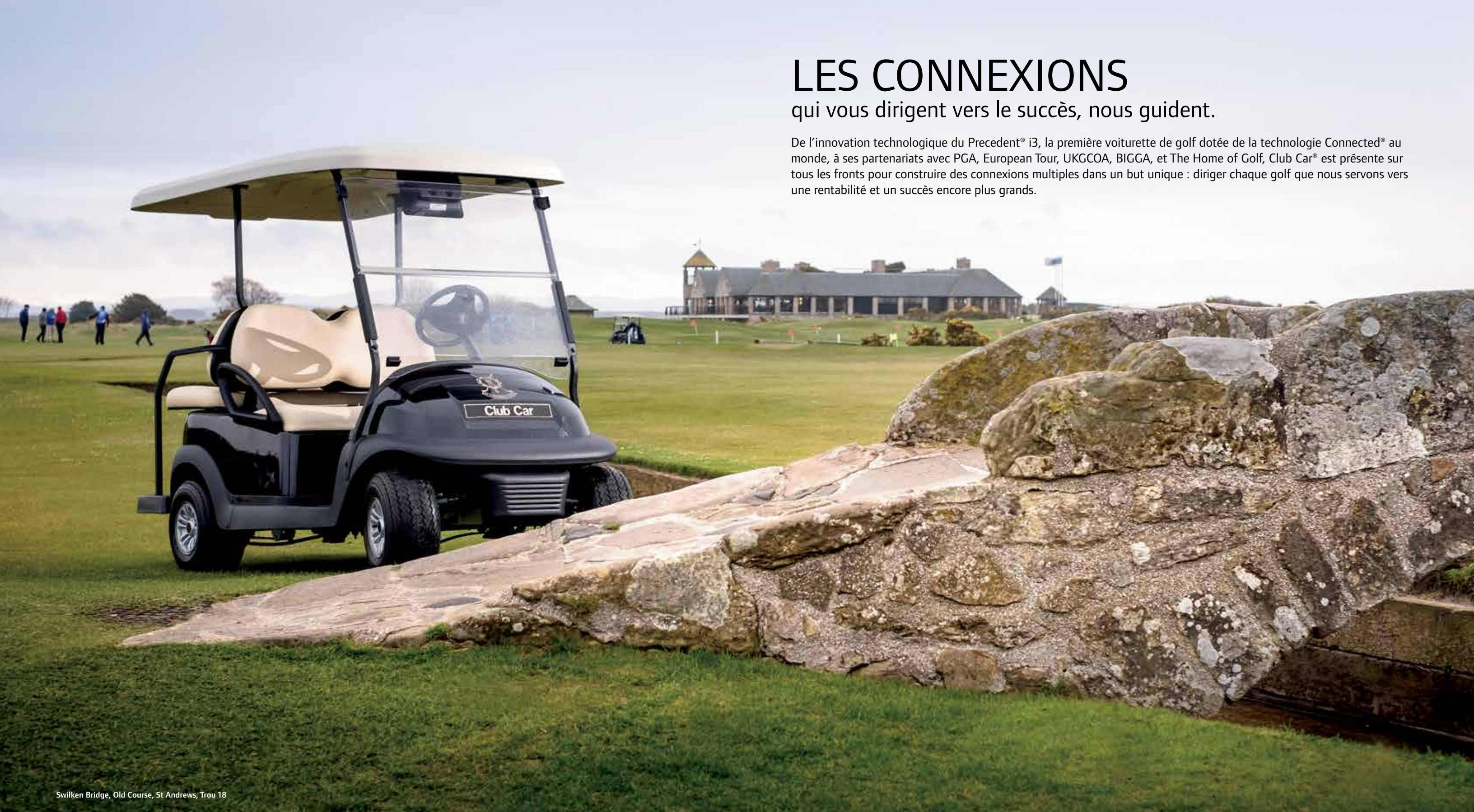
Swilken Bridge, Old Course, St Andrews, Trou 18

De l'innovation technologique du Precedent® i3, la première voiturette de golf dotée de la technologie Connected® au monde, à ses partenariats avec PGA, European Tour, UKGCOA, BIGGA, et The Home of Golf, Club Car® est présente sur tous les fronts pour construire des connexions multiples dans un but unique : diriger chaque golf que nous servons vers une rentabilité et un succès encore plus grands.