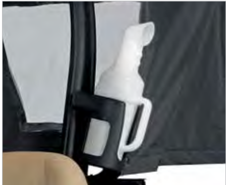
BOUEILLE DE SABLE POUR RÉPARER LES MOTTES