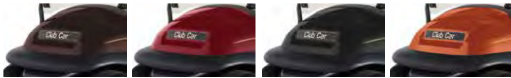
MOKA SANGRIA NOIR CAYENNE