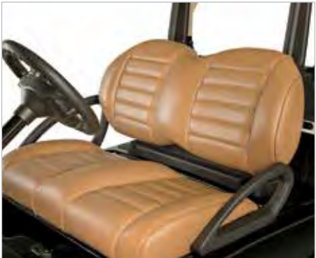
SIÈGES HAUT DE GAMME UNIS OU BI-TONS