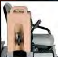
DISTRIBUTEUR DE BOISSON