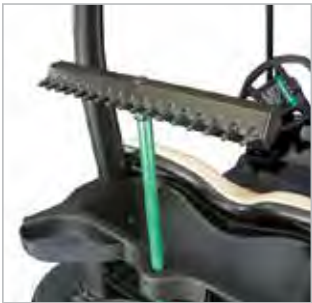
KIT DE RATISSAGE DE SABLE