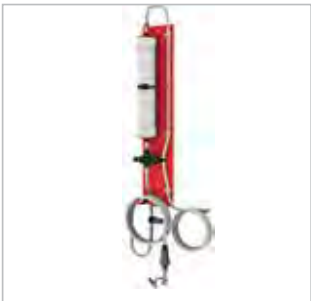
DÉSONISEUR D’EAU POUR UN SYSTÈME D’ARROSAGE À POINT UNIQUE