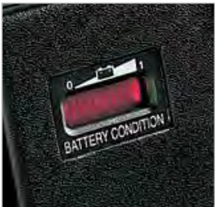
INDICATEUR DU NIVEAU DE CHARGE DE LA BATTERIE