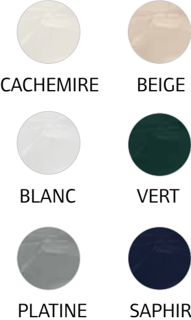
CACHEMIRE BEIGE BLANC VERT PLATINE SAPHIR