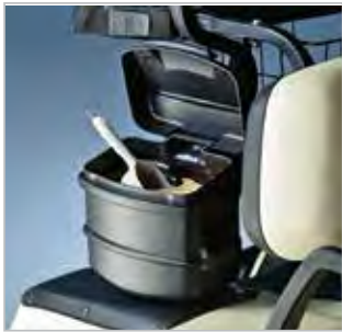
SEAU À SABLE