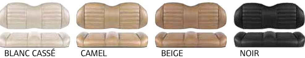
BLANC CASSÉ CAMEL BEIGE NOIR