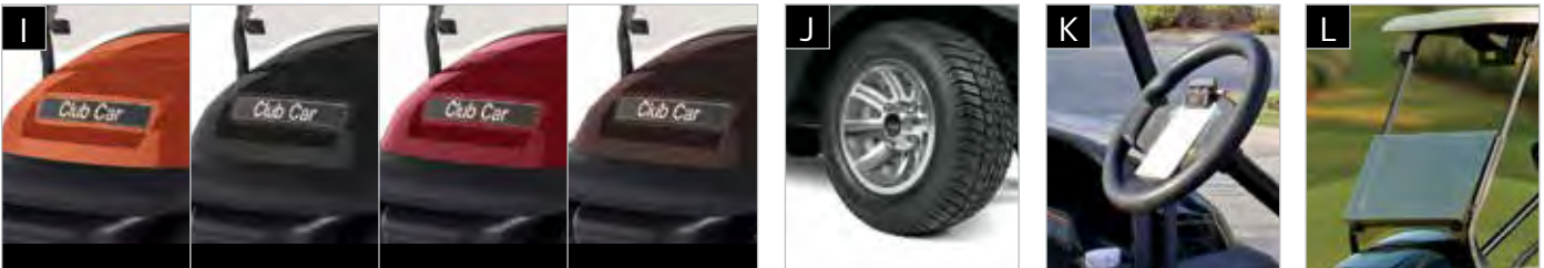
I DE GAUCHE À DROITE : CAYENNE, NOIR, SANGRIA ET MOKA J JANTES EN ALLIAGE K VOLANT CONFORTABLE L PARE-BRISE TEINTÉ À CHARNIÈRE

Disponible sur les véhicules Precedent 2 passagers, et comprend toutes les options incluses dans le kit de luxe, avec un pare-brise teinté amélioré, PLUS les options supplémentaires suivantes destinées à différencier votre activité. Inclut les accessoires I - M et deux accessoires de votre choix (N - R). Les options de peinture métallisée sont disponibles pour une amélioration supplémentaire.