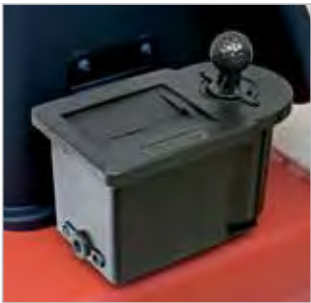
NETTOYEUR DE BALLE ET DE CLUB