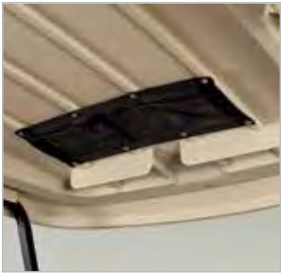
FILET DE STOCKAGE DE PLAFONNIER