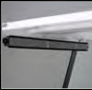
RÉTROVISEUR À 5 PANNEAUX