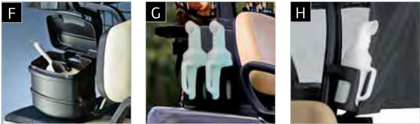
F SEAU À SABLE G DEUX BOUTEILLES DE SABLE H BOUTEILLE DE SABLE