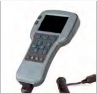
MODULE D’AFFICHAGE IQ