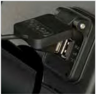
DOUBLE PORT USB