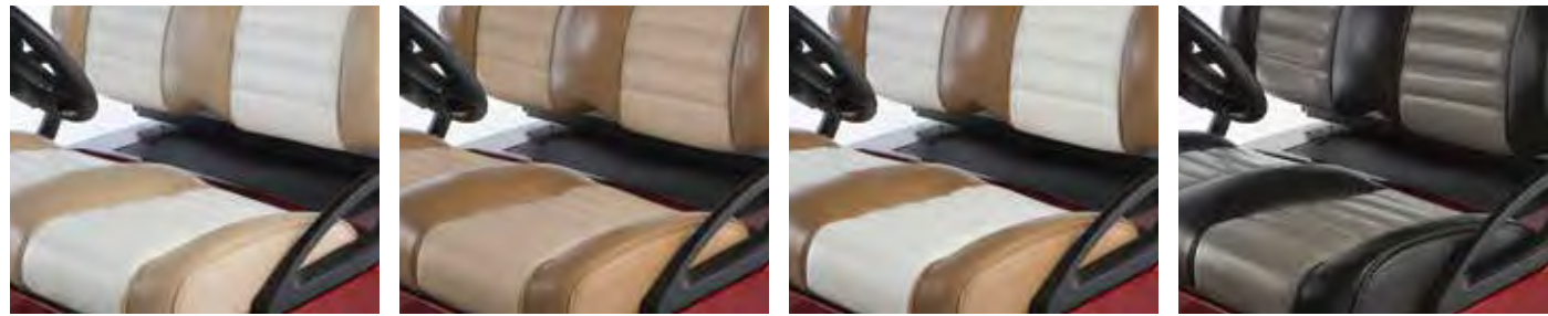
BEIGE ET BLANC CASSÉ CAMEL ET BEIGE CAMEL ET BLANC CASSÉ NOIR ET GRIS