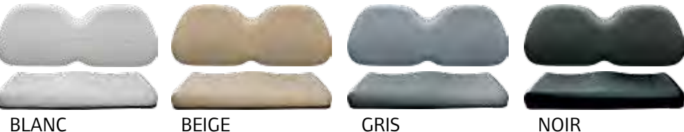
BLANC BEIGE GRIS NOIR