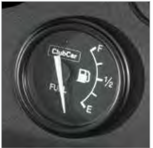
JAUGE DE CARBURANT