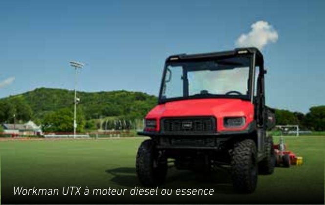
Workman UTX à moteur diesel ou essence

Qu'il s'agisse de transporter de lourdes charges ou des équipes de travail essentielles, Toro est fière de proposer une gamme complète de véhicules pour répondre à tous les besoins. Pour les tâches plus rudes, il n'y a pas de meilleure option que les véhicules utilitaires Workman Toro. Premier choix des professionnels de l'entretien des terrains, les véhicules utilitaires Workman offrent une fiabilité et une puissance exceptionnelles ainsi que des charges utiles élevées.