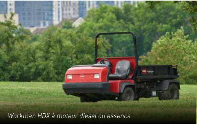
Workman HDX à moteur diesel ou essence