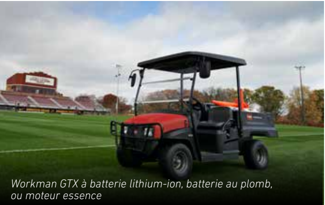
Workman GTX à batterie lithium-ion, batterie au plomb, ou moteur essence