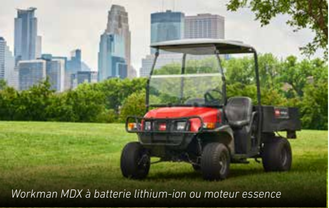
Workman MDX à batterie lithium-ion ou moteur essence