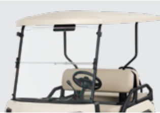
Abri – 4, 6 & 8 places (exigé sur les modèles 4 places)

Plusieurs accessoires permettent d'améliorer l'utilisation et la fonction des modèles Vista, notamment un abri en option pour la protection contre les intempéries et un pare-brise rabattable pour se protéger du vent et des débris. Ces accessoires et autres outils contribuent à offrir une expérience sécuritaire et agréable.