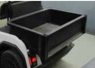
Plateau de chargement (léger)