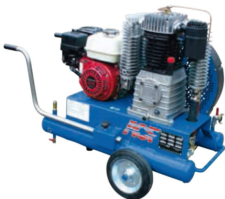
Compresseur CM4HL Moteur essence HONDA GX 200 Démarrage lanceur Débit 30 m 3 /h ou 500 l/mn réel à 7 Bar et 1 sortie en raccord express