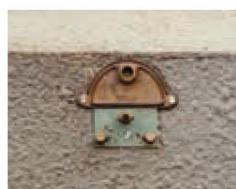
Plaque 1 trou ø 14 Buse courte ø 4