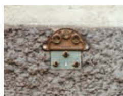
Plaque 3 trous ø 20 Buse longue ø 4