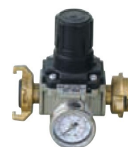
Manodétendeur P 100