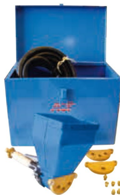
ENDUVIT 3 en coffret P 381 Comprend 1 P 380, 1 ensemble de plaques et bouchons, 10 m tuyau air comprimé, 1 coffret métallique